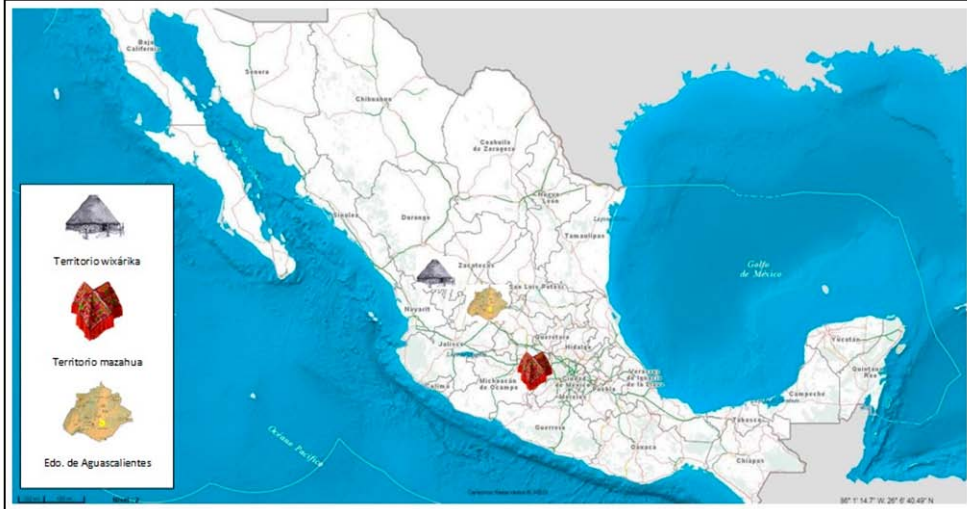
Figura1: Territorios de origen y destino de los migrantes en Aguascalientes.

ello, las familias de ambos pueblos destinan una considerable cantidad de recursos obtenidos de las actividades comerciales a la organización de ceremonias agrícolas en sus comunidades de origen.